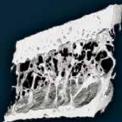
绝经后患者基线时