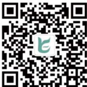
扫描二维码领取学分

尊敬的参会代表：根据国家继教委要求，会议结束时需要大家评估本次继续教育活动并将各位代表的相关信息上传。如需要学分请扫描下方二维码，关注中国健康老龄网，在后台回复“大连学分”，会出现评估问卷和信息收集问卷的链接（10月21-22日）。请点击链接认证完成问卷填写。根据评估问卷和学分备案相关信息，我们将为大家办理学分备案，11月初可在国家继续教育网站查阅学分。谢谢！