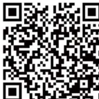
大连会议群二维码